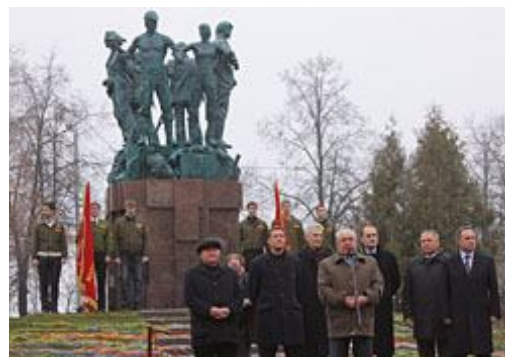
Открытие памятника студенческим стройотрядам

Мнение автора может не совпадать с мнением редакции ... а может и совпадать :)